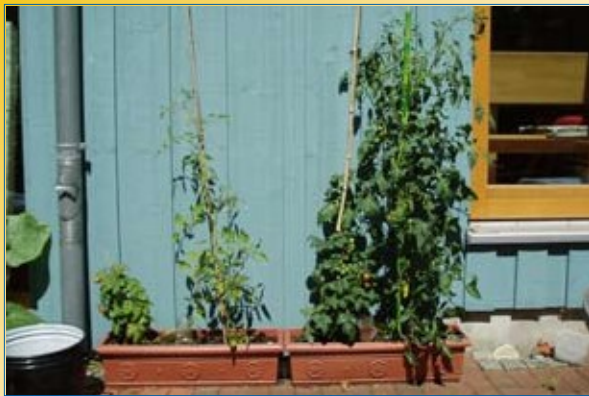
Kako korištenje urina poboljšava plod

Urin je izvrsno gnojivo koje sadrži azot, fosfor, kalij i mnoge mikro-hranjive tvari. Hranjive tvari u urinu biljke uzimaju jednostavno. oplodjena biljka će rasti brže, razviti više listova i proizvesti veće prinose. Primjena urina na usjevima umjesto hemijskih gnojiva štedi novac energiju i proizvodi sličan plod. Jedna osoba proizvodi oko 500 litara urina godišnje